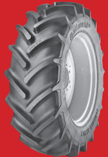
ContiContract AC 70