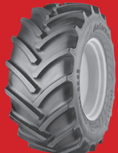
ContiContract AC 65