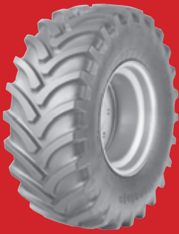
MPT AC 70